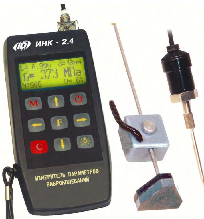
Рисунок 2 – Общий вид измерителя механических напряжений и параметров виброколебаний ИНК-2.4 (модификация ИНК-2.4К)