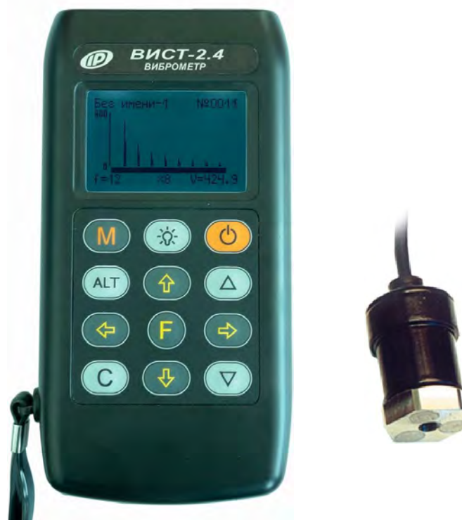
Рисунок 4 – Общий вид измерителя механических напряжений и параметров виброколебаний ИНК-2.4 (модификация ВИСТ-2.4 исполнение 2)