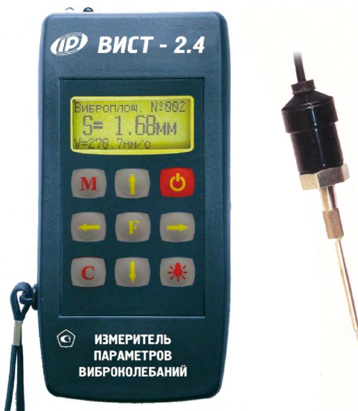
Рисунок 3 – Общий вид измерителя механических напряжений и параметров виброколебаний ИНК-2.4 (модификация ВИСТ-2.4 исполнение 1)