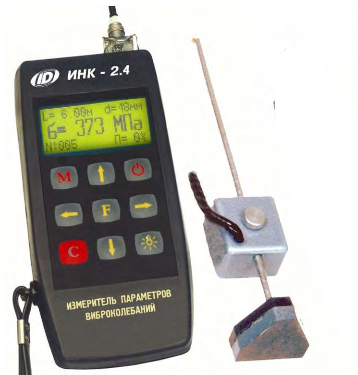
Рисунок 1 – Общий вид измерителя механических напряжений и параметров виброколебаний ИНК-2.4 (модификация ИНК-2.4Н)